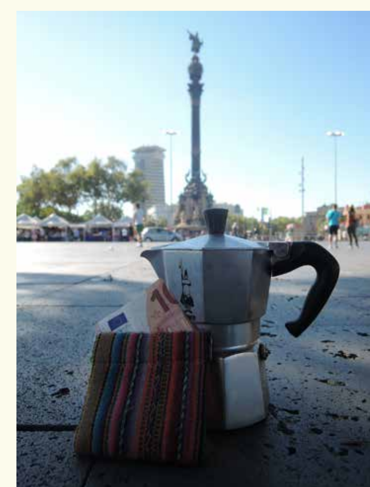
Killa (pseudonim, lună în limba quechua), proiect fotografic individual despre ce înseamnă astăzi a trăi în Europa (Barcelona, august 2016).

Mai sunt actuale princiile Declarației Schuman?