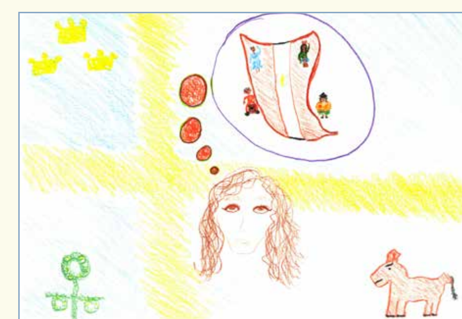
F (pseudonim), reprezentare artistică a rădăcinilor multiculturale (Stockholm, august 2016).