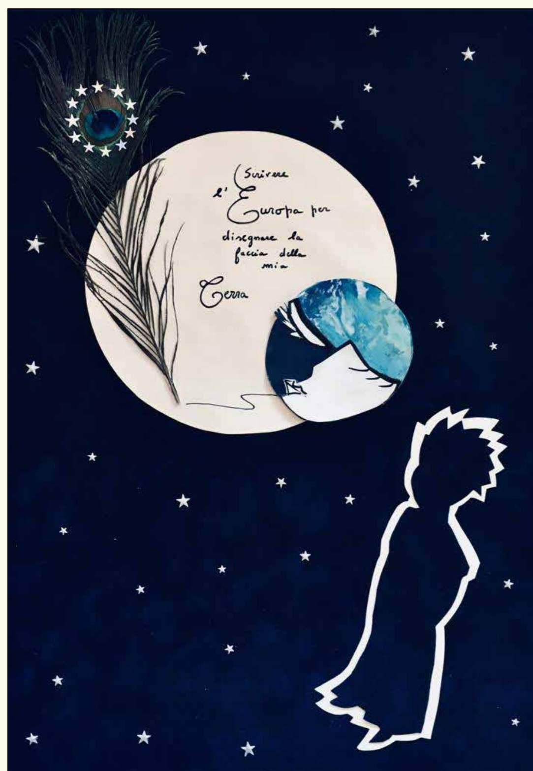
Escola secundária francesa, programa educativo AHUE, Janeiro de 2020.