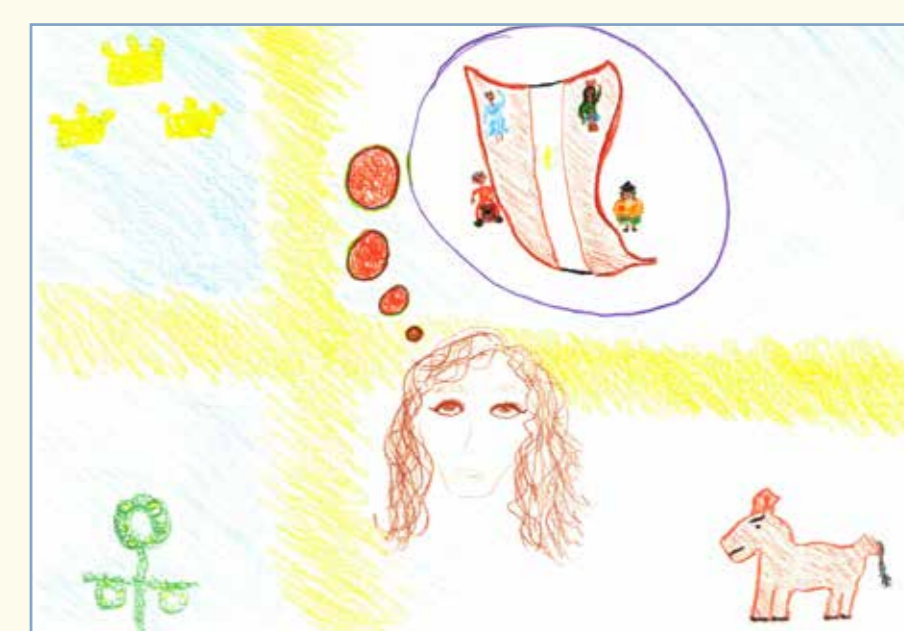
F. (psedónimo), Representação visual de raízes multiculturais. Estocolmo, agosto de 2016.