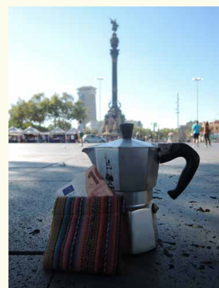
Killa (psedónimo, lua em língua quíchua), projecto fotográfico individual sobre o significado de viver na Europa de hoje. Barcelona, agosto 2016.