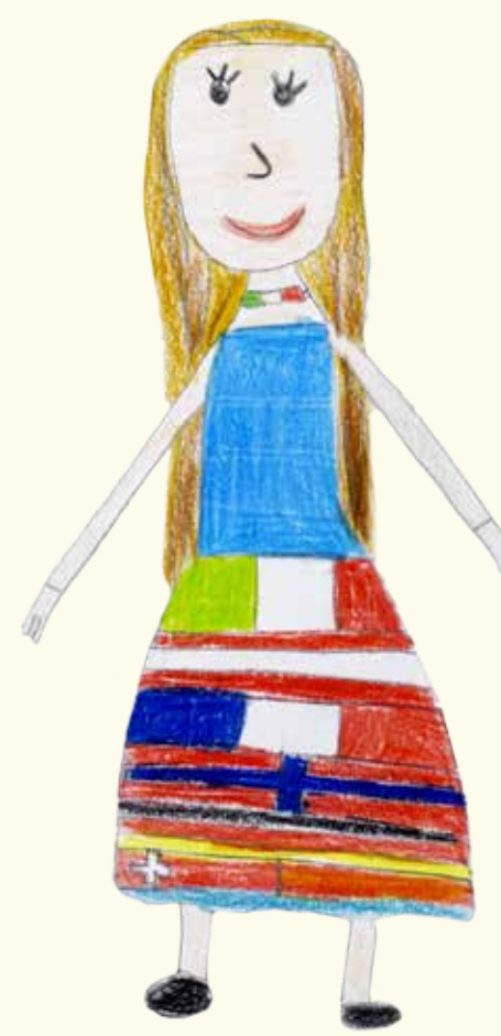
Pamatskola, 2019. gada marts.

Un due tre. Eu-ro-pa! Music: Tchaikovsky - Chanson Italienne - Op.39 n° 15 Un due tre Eu ro pa... Un due tre Eu ro pa... Se mi guardi ti faccio scoprire cosa sono dentro di me. Nei ricordi di infanzia passata dai miei nonni a me. Se guardi dentro di me vedrai storie sconosciute ma tutti i personaggi uniti a te con dei fili Europa.