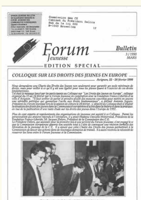
Pa kreisi: fragments no Eiropas Komisijas priekšsēdētāja Žaka Delora uzrunas laikraksta „Le Monde” rīkotajā konferencē „Izglītība Eiropas projekta centrā” sadarbībā ar EEK un Sorbonnas Universitāti, 1988. gada 2. marts. HAEU, JD 72. Pa labi: Eiropas Jaunatnes foruma apkārtraksts. HAEU, JD 981.

Économiques et sociaux, les enseignants et les universitaires, alors même que certains hommes politiques multipliaient les préalables et les obstacles. N'ont-on pas entendu dire qu'on renégocierait le traité d'adhésion de l'Espagne et du Portugal, qu'on reverrait l'Acte Unique européen, que l'on refuserait à la Communauté des moyens financiers supplémentaires ? Je me souviens qu'au Conseil européen de Londres - en décembre 1986 - intervenant pour demander aux Chefs de Gouvernement les plus récalcitrants de reconsidérer leur opposition au programme Erasmus, j'avais sous les yeux un téléx envoyé par 40 doyens de facultés d'Europe apportant un soutien puissant et chaleureux aux propositions de la Commission européenne. J'avais été frappé par le caractère imposant et rapide de cette mobilisation qui confirmait que le monde universitaire n'était lancé de plein pied avec nous dans l'aventure. Les raisons en sont sans doute multiples : L'ouverture des jeunes sur le monde, le mouvement irrésistible d'accès à la connaissance, la vocation universelle de la culture universitaire. Des thèses savantes seront je l'espère produites sur ce phénomène, mais je me dois simplement de souligner ici la dynamique propre du système éducatif, de ceux qui l'assument quotidiennement et vous dire les contours de cette Europe du libre échange intellectuel que nous bâtissons ensemble.