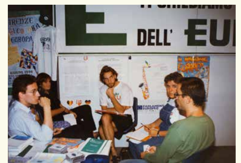
Kustības „Movimento Federalista Europeo” (MFE) aktivitātes tās galvenajā birojā Florencē, Itālijā, 1996. gada jūnijā. HAEU, SP 85 - Photo: Unknown.

ir bijuši konkrētu ES politikas iniciatīvu (piemēram, Erasmus pamatprogramma) mērķauditorija, taču vienlaikus viņi ir arī proaktīvi pauduši savu Eiropas redzējumu, jau kopš pašiem Eiropas integrācijas aizsākumiem apvienojoties asociācijās un kustībās. Tas, kā bērni un jaunieši uztver Eiropas telpu, ir bijusi Eiropas politiku ietekmes mēraukla un vienlaikus Eiropas nākotnes plānu pamats.