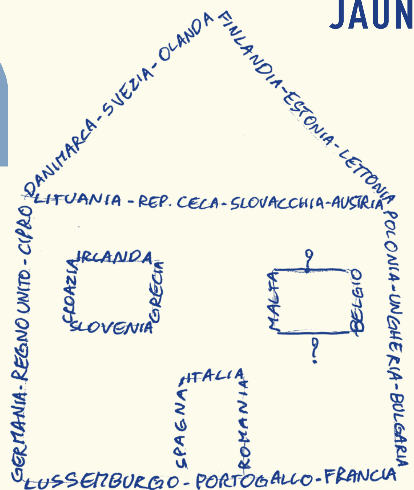
Vidusskola, 2019. gada decembris.