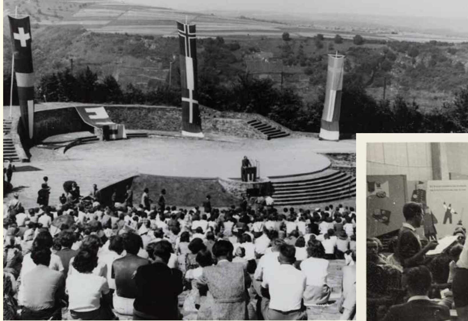
Eiropas jaunatnes starptautiskā nometne Lorelejā, Vācijā, 1951. gads.

Lorelejas nometne bija viena no neskaitāmajām Eiropas jaunatnes organizētajām iniciatīvām 20. gadsimta 50. gadu sākumā.