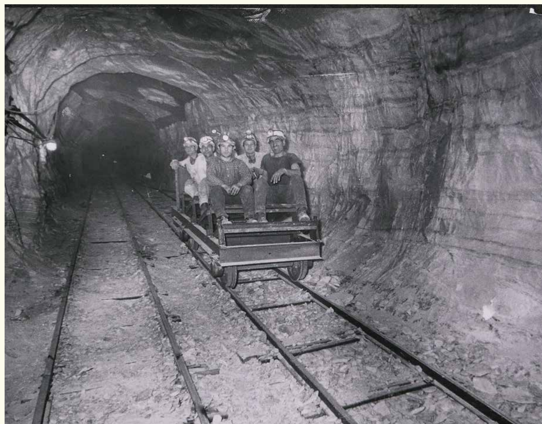
No kreisās uz labo pusi: raktuvju strādnieki Sicīlijas centrālajā daļā (Itālija), 1962. HAEU, BEI 2157 - Photo: Unknown; atvasāju ogļu raktuves strādnieki, 1958. HAEU, CEAB09 586 - Photo: Unknown; Pirmās EOTK izsniegtās Eiropas pases, 1953. HAEU, CEAB02 122 - Photos: ERSC/USI and unknown authors