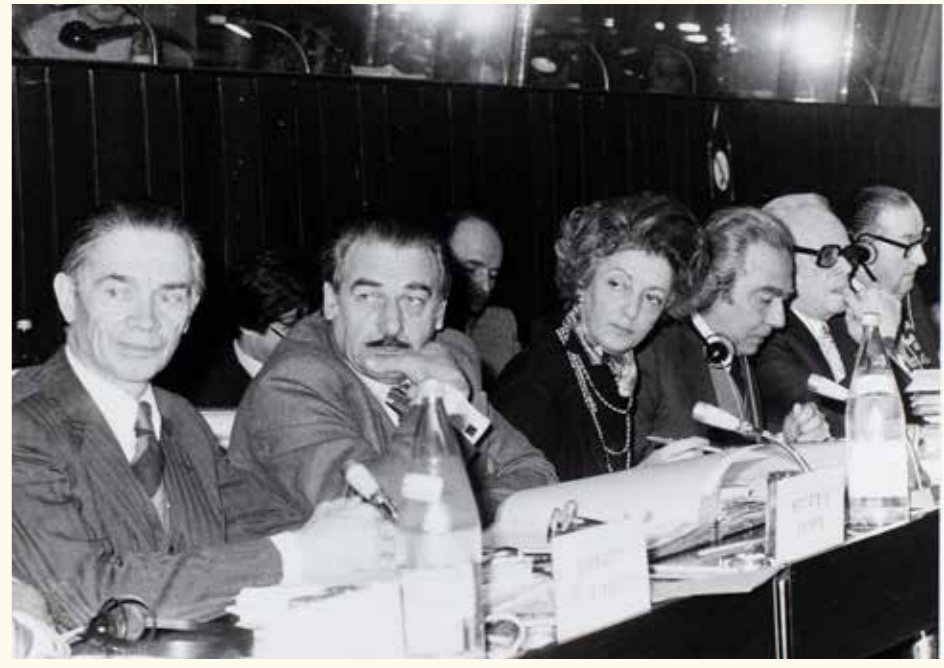
Fabrice Baduela Glorioso EESK 163. plenārsēdē, Brisele, 1978. gada 29. – 30. novembris. HAEU, FBG 107

Fabrice Baduela Glorioso (Perudža, 1927–2017) bija Itālijas un Eiropas asociāciju un iestāžu darbībā iesaistīta arodbiedrību aktiviste. 1978. gadā viņa ievēlēja par Eiropas Ekonomikas un sociālo lietu komitejas (EESK) priekšsēdētāju; šo komiteju veido darba devēji, arodbiedrību biedri un pilsoniskās sabiedrības organizāciju pārstāvji. Viņa bija pirmā Eiropas Kopienas institucionālās struktūrvienības priekšsēdētāja amatā ievēlētā sieviete.