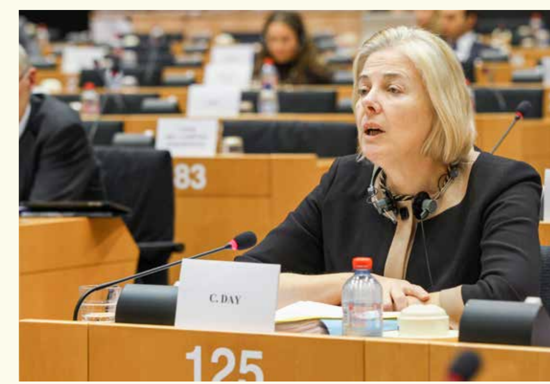
Catherine Day

Secretarul General al Comisiei Europene în perioada 2005 - 2015