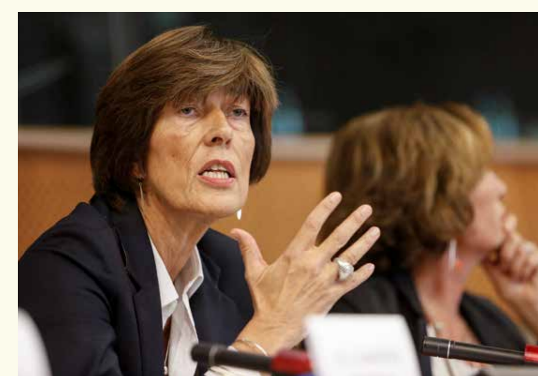
Christine Verger © European Union 2013 Source: EP - Photo: Jennifer Jacquemart

Înalt oficial european în perioada 1987 - 2009