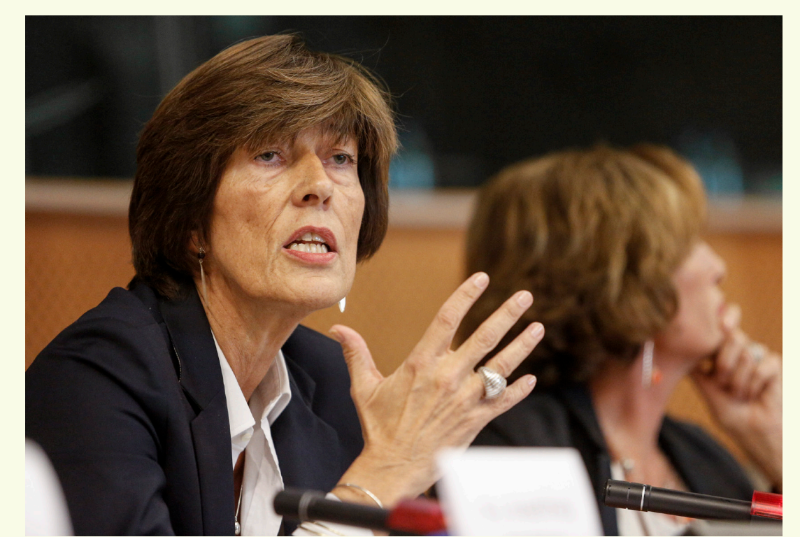
Кристин Верже