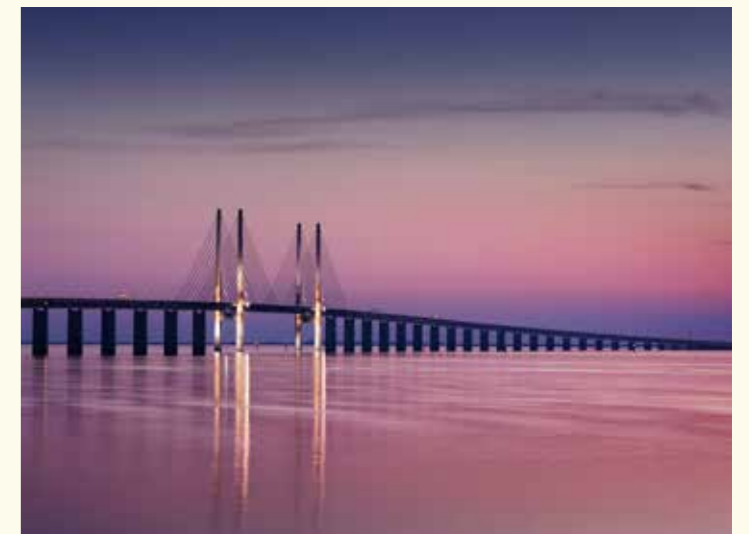
Ēresunda tilts – saikne starp Zviedriju un Dāniju.