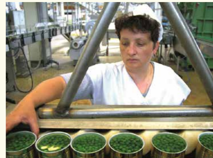
Pārtikas rūpniecības nozare Moldovā.