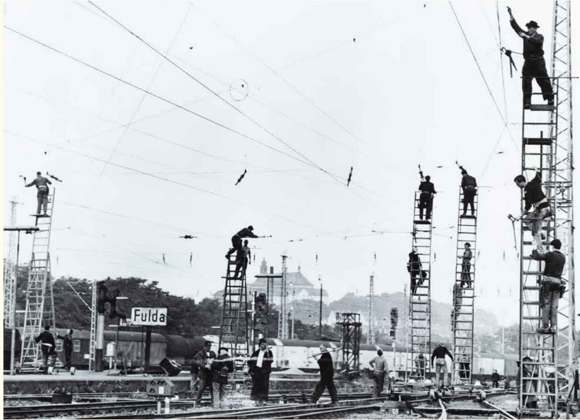
Eiropas Investīciju bankas (EIB) projekts „Deutsche Bundesbahn” (Vācija), 1960–1961: dzelzceļa elektrifikācija ziemeļu–dienvidu ass savienojumā. HAEU, BEI 2165 - Photo: Unknown.