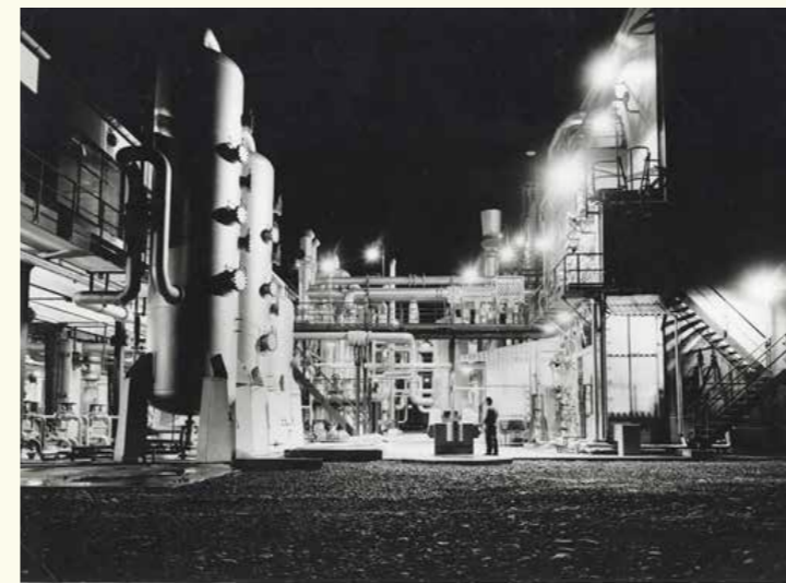
Acetilēna rūpnīcas būvniecība Francijas dienvidrietumos. HAEU, BEI 2144 - Photo Unknown.