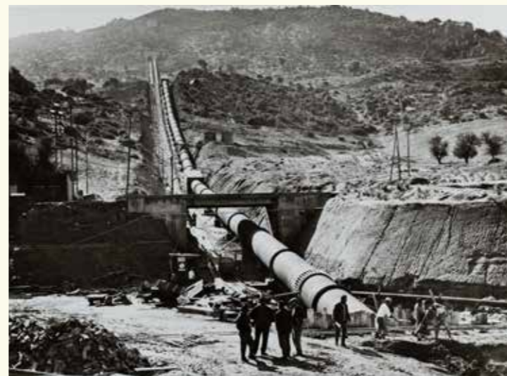
Hydroelektrostacijas būvniecība Taloro, Sardinijā (Itālija). HAEU, BEI 2154 - Photo Unknown.