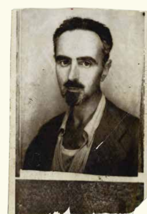
Stânga: Manifestul de la Ventotene, cu notele manuscrise originale ale lui Altiero Spinelli (1941). HAEU, AS 3. La mijloc: Document de identitate al lui Altiero Spinelli. HAEU, AS 210. Dreapta: Fotografie cu Ernesto Rossi.