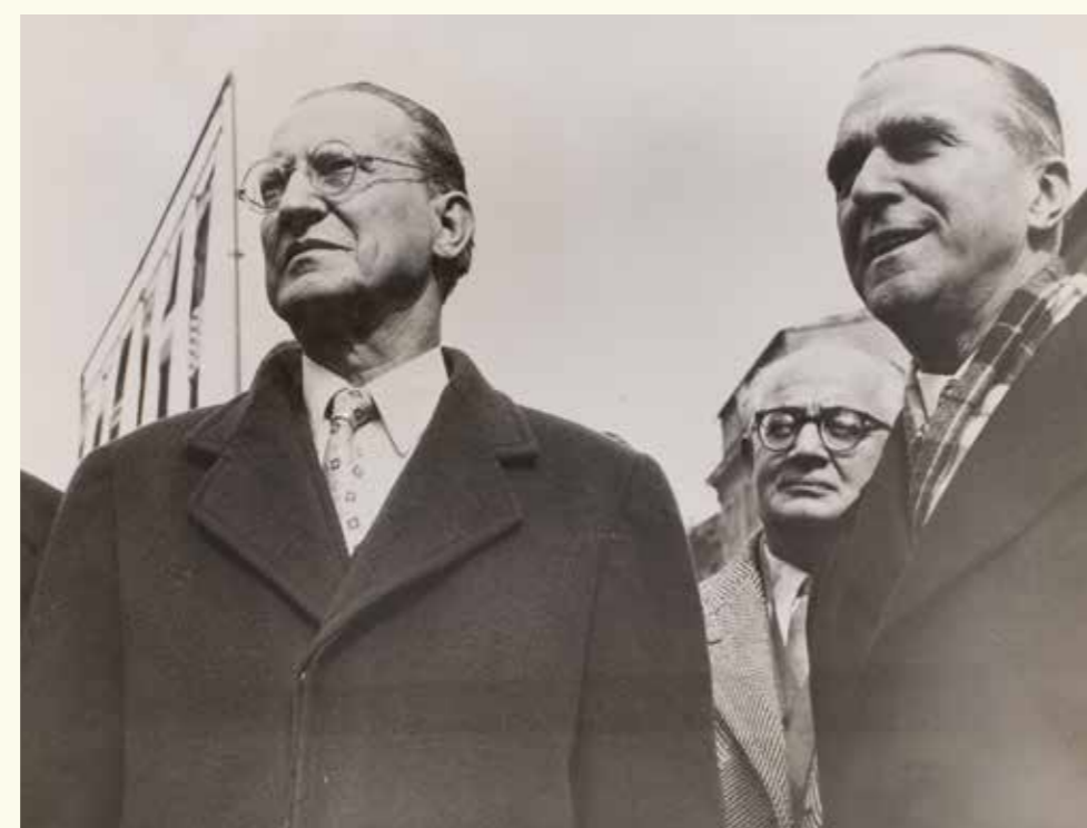
Em baixo: Alcide De Gasperi. HAEU, ME 1549 - Photo: Unknown.

Esquerda: Notas manuscritas do discurso de Fernand Dehousse, membro da Assembleia Europeia (hoje Parlamento Europeu), perante o Senado belga, em 3 de Março de 1954, sobre a proposta de uma Comunidade Europeia de Defesa. HAEU, FD 76.