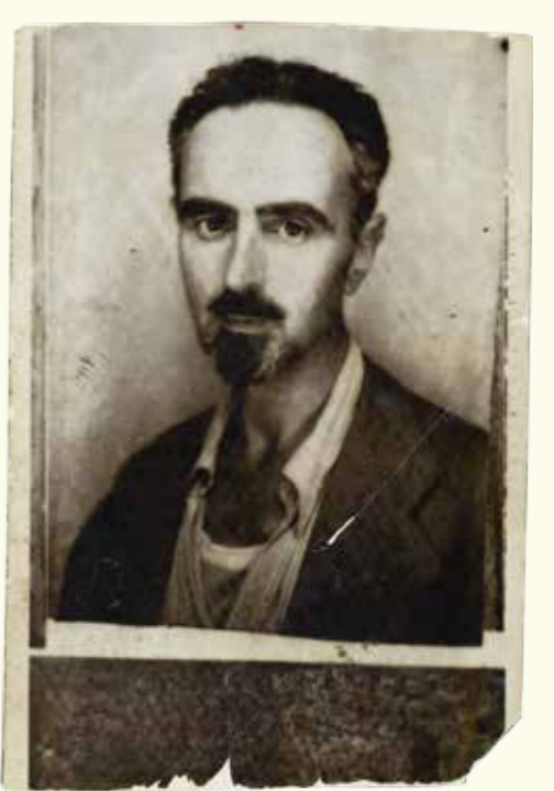
Esquerda: Manifesto de Ventotene, com notas manuscritas originais de Altiero Spinelli, 1941. HAEU, AS 3. No meio: Documento de identidade de Altiero Spinelli. HAEU, AS 210. Direita: Retrato de Ernesto Rossi.