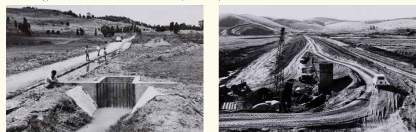
Em baixo: PProjeto de desenvolvimento hidro-agrícola do Fundo Europeu de Desenvolvimento (FED) em Madagáscar, 5 de Janeiro de 1972.