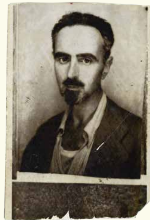
Pa kreisi: Manifesto di Ventotene, ar oriģinālajām Altjero Spinelli piezīmēm manuskriptā, 1941. HAEU, AS 3. Vidū: Altjero Spinelli personu apliecinošs dokuments. HAEU, AS 210. Pa labi: Ernesto Rosi portrets.