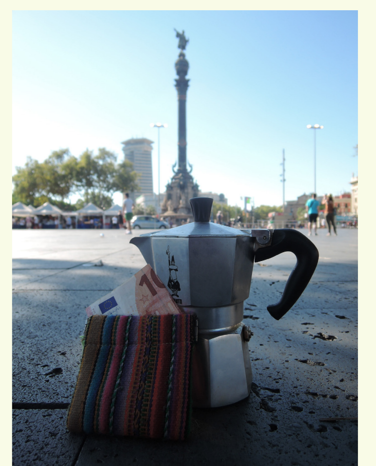
Killa (Pseudonym, "Mond" in Quechua-Sprache), individuelles Fotoprojekt zur Bedeutung des Lebens im heutigen Europa. Barcelona, August 2016.