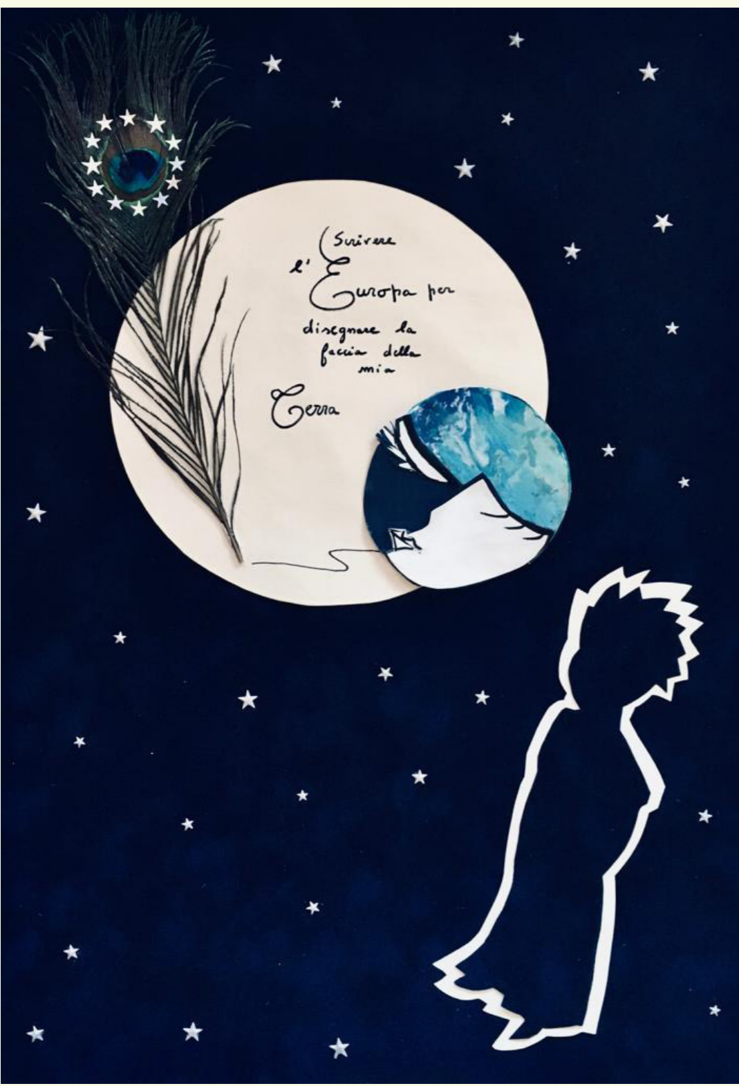
Französisches Gymnasium, HAEU-Bildungsprogramm, Januar 2020.

Sollte man die Bindung des einzelnen Bürgers an die Europäische Union als eine auf mehreren Ebenen funktionierende Bindung betrachten? Und zwar auf einer individuellen, familiären, generationsbezogenen, regionalen und nationalen Ebene? Für jede Generation ist ein tiefes Ausloten dieser Fragen die Voraussetzung, um aufs Neue über die EU nachzudenken, sie zu entwickeln und zu fördern.