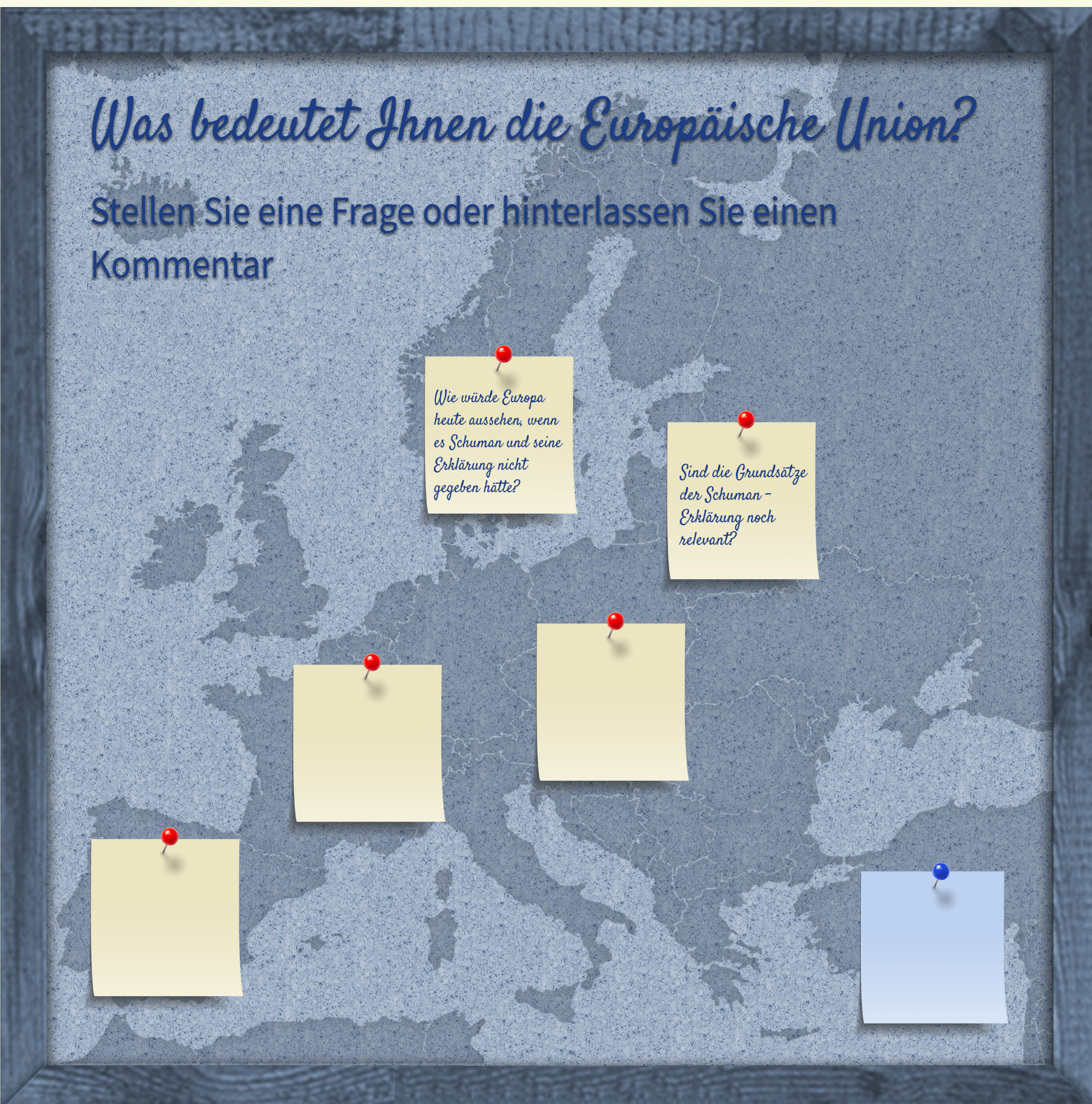
Italienisches Gymnasium, HAEU-Bildungsprogramm, November 2019.

“Die Europäische Union ist für mich wie der Mond, fast immer sichtbar, immer präsent, er scheint um uns herum zu sein und nichts Wichtiges zu tun, aber in Wirklichkeit trägt er zu unserem Wohlbefinden bei, indem er direkt wirkt, ohne dass man es sofort bemerkt.”