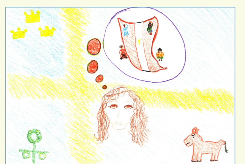
F. (Pseudonym), Visuelle Darstellung multikultureller Wurzeln. Stockholm, August 2016.