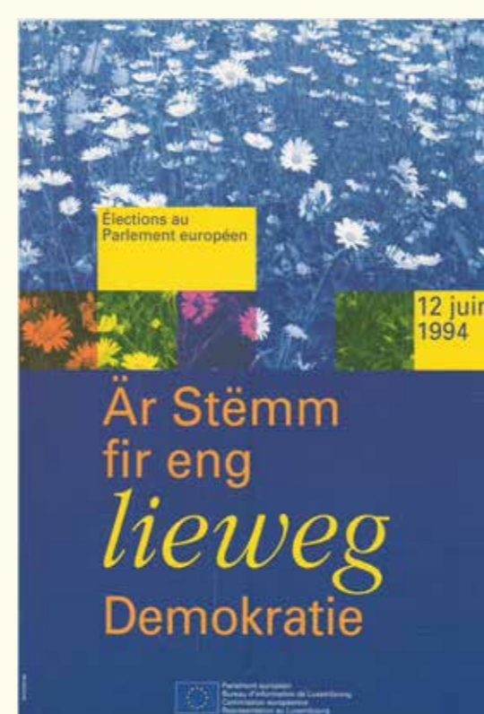
HAEU, NDG 132