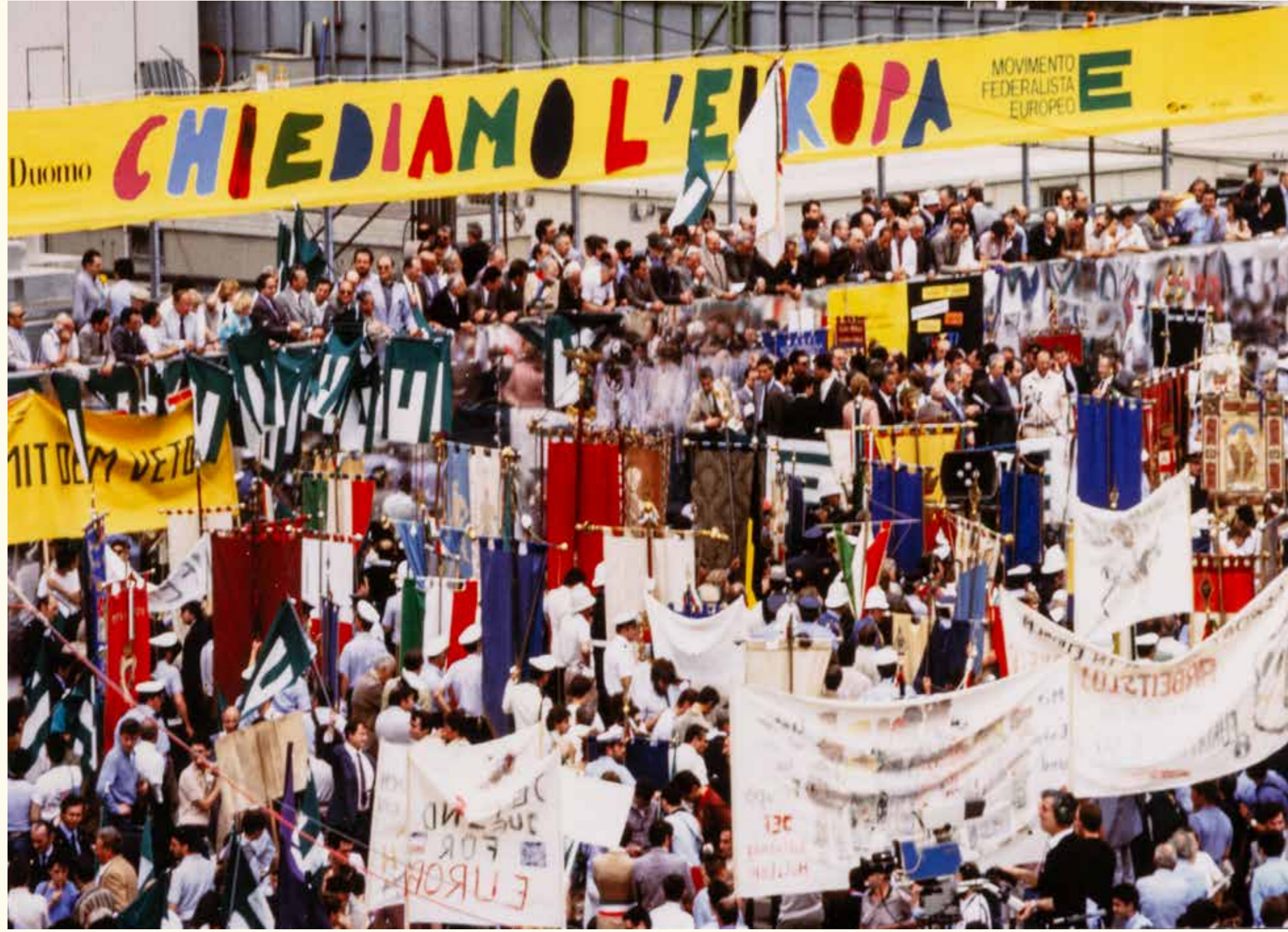
Demonstrație în favoarea Europei federale (Milano, 29 iunie 1985). HAEU, UEF 415 - Photo: Unknown.