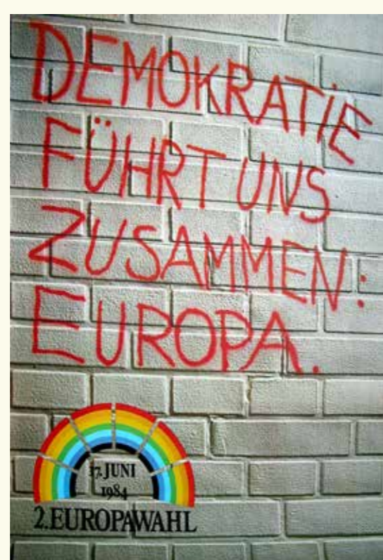
HAEU, NDG 192

Afișe ale Parlamentului European privind alegerile europene (1979-2009).