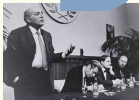
Altiero Spinelli în cadrul unei conferințe (Anvers, 1972).