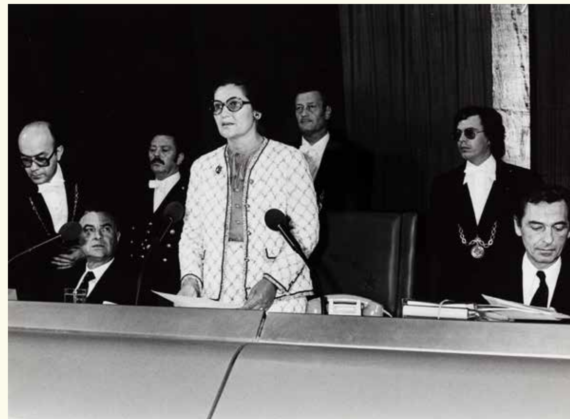
Sus: Simone Veil în Parlamentul European (17 iulie 1979).

Simone Veil (1927, Nisa - 2017, Paris), avocat și politician francez, ministru al sănătății și membru al Consiliului Constituțional din Franța. Supraviețuitoare a lagărului de concentrare de la Auschwitz - Birkenau, a fost aleasă pe 17 iulie 1979 Președintă a Parlamentului European, pentru prima oară prin alegeri directe.