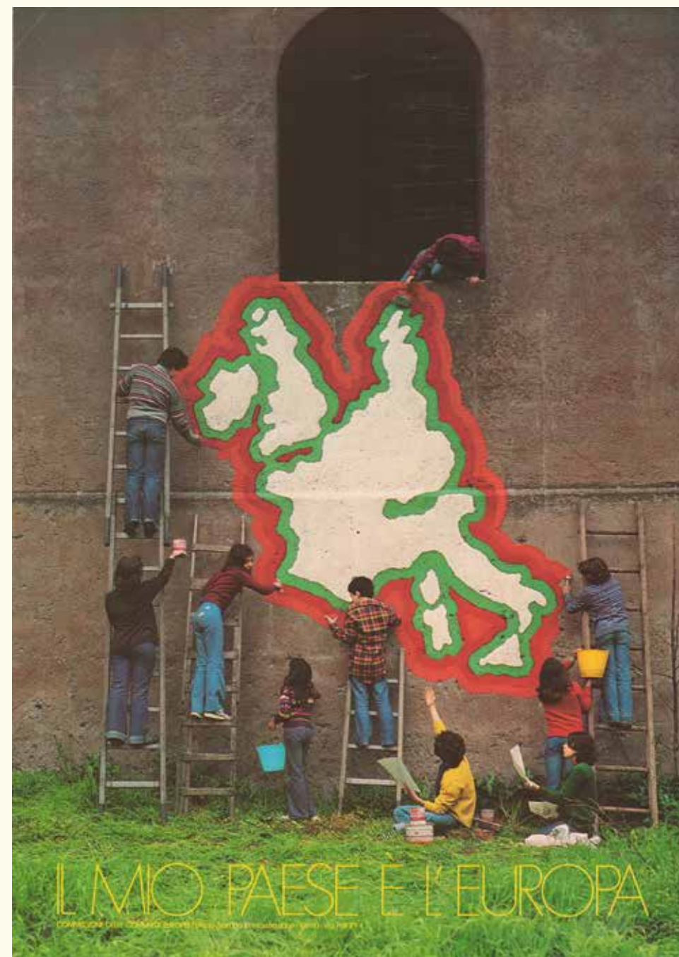
Afiș al Comisiei Europene. HAEU, NDG 250.

De la propunerea franco-germană privind producția de cărbune și oțel, Europa a devenit actuala Uniune Europeană cu 27 de state membre, în mai puțin de 70 de ani. Ideea extinderii la „toate țările care doresc să ia parte” a fost deja consacrată de Declarația Schuman, dar a dobândit un sens mai profund pe măsură ce noii membri proveneau din sudul, nordul și, cel mai recent, din estul Europei. De asemenea, statele membre pot decide să părăsească Uniunea, așa cum a demonstrat Brexit-ul.