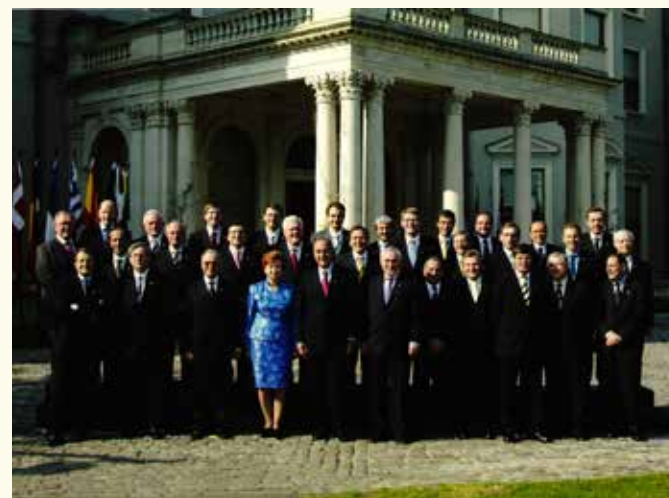
Sus - De la stânga la dreapta: Afiș al Comisiei Europene din 2001. HAEU, NDG 130; Notă din 22 mai 2002 semnată de Graham Avery, consilier-șef pe probleme strategice în cadrul Direcției Generale pentru Extinderea Comisiei Europene, privind negocierile de aderare. HAEU, GJLA 220; Scrisoarea din 11 mai 2004 a Președintelui Consiliului European, Bertie Ahern, către Președintele Comisiei Europene, Romano Prodi. HAEU, RP 495

La 1 mai 2004, zece noi state au fost primite în Uniunea Europeană, printr-o ceremonie care a avut loc la Dublin.